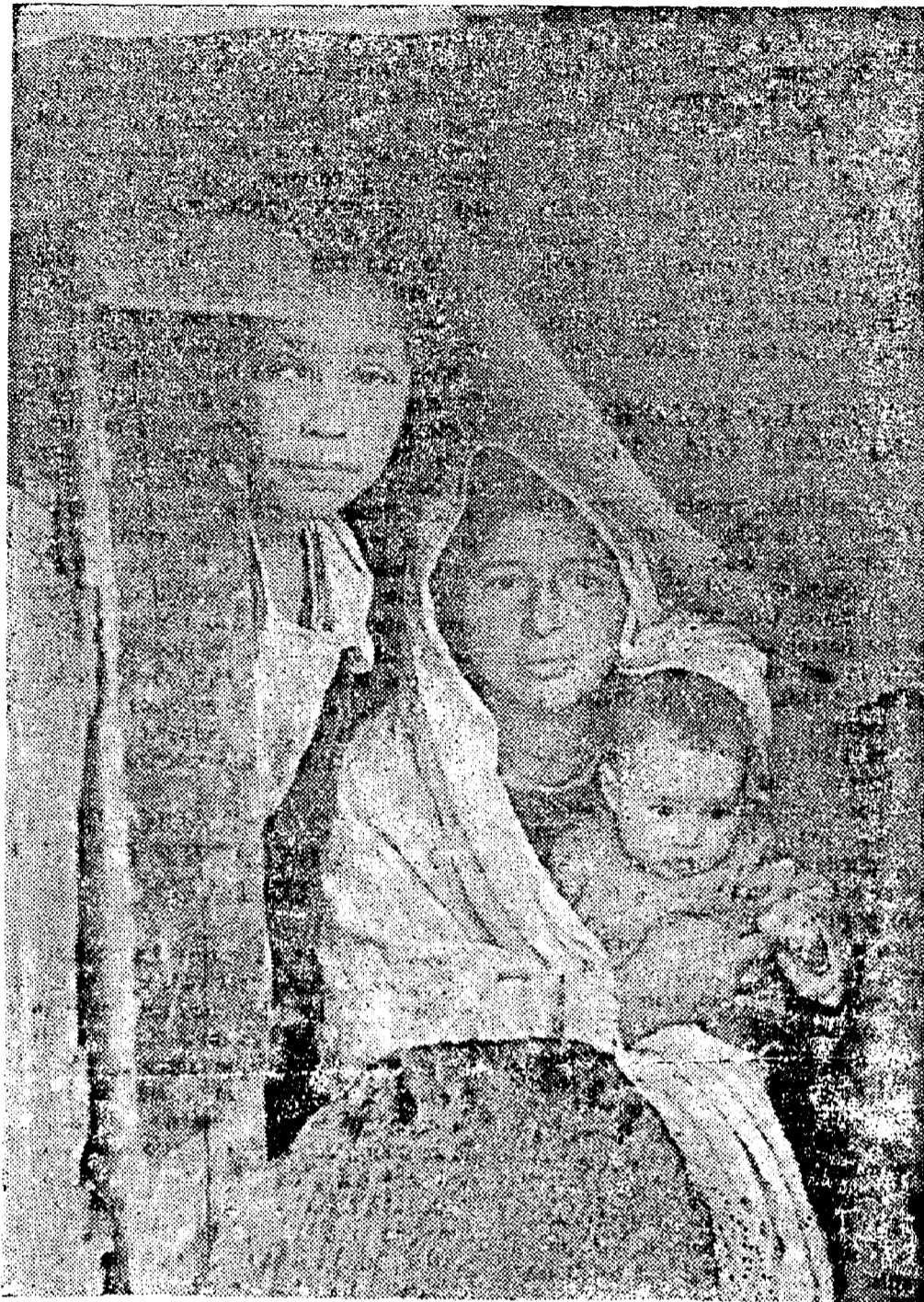
Los revolucionarios no se guían por el principio antihumanista y reaccionario de "tanto peor, tanto mejor".

En cuanto a la tercera cuestión, Uds. afirman: "estimamos que todas nuestras declaraciones y las de Uds. con respecto a la unidad y a la necesidad de mantenerla serían meras declaraciones líricas si no hay un objetivo común que las sustente y dinamice. No basta para mantener la unidad que tenga-