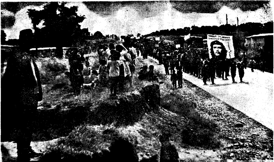
LOS CAMPESINOS chilenos se han puesto en pie de lucha en todo el país para conquistar la tierra y ponerla a producir en beneficio de las grandes masas.

niveles: se pasean armados por los campos de Chile, desalojan y asesinan campesinos, insultan por sus diarios, conspiran descaradamente. Atrincherados en el Parlamento, escondidos detrás de las banderas de la ley y el orden golpean a los trabajadores, avanzan y logran retomar algunas posiciones. Incluso llegan a confundir a sectores del pueblo.