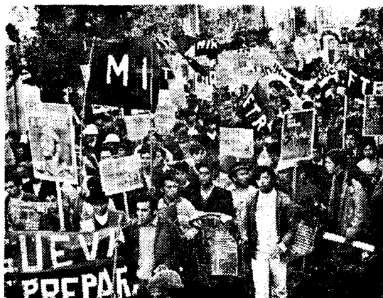
Los trabajadores definen un camino propio

Demasiado cerca está la experiencia boliviana, es muy alto el costo de los errores y no es tan débil la izquierda y el movimiento de