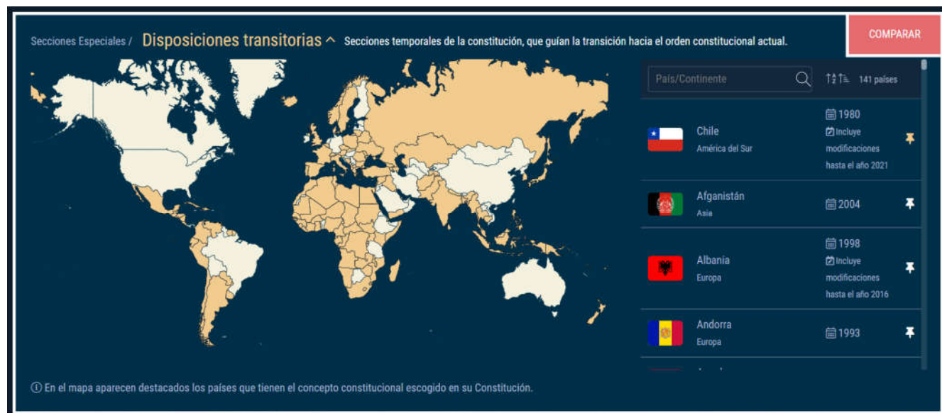
Figura 2. Existencia de disposiciones transitorias en las constituciones vigentes del mundo