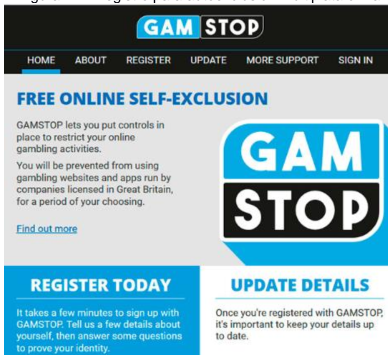
Figura n°1. Registro para autoexclusión multiplataforma

Una solicitud de autoexclusión en GAMSTOP no activa una devolución automática de fondos retirables de aquellas empresas con las que tiene cuentas. Deberá comunicarse directamente con la empresa. GAMSTOP no es responsable de la devolución de fondos.